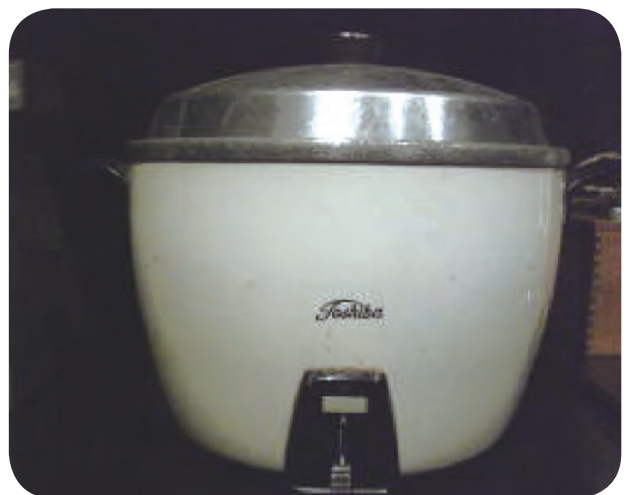
電気がま（電気すいはん器）