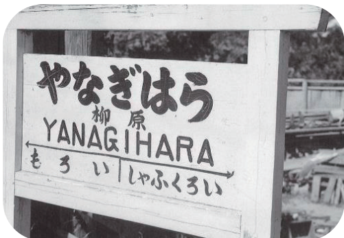
柳原（袋井市）の停りゆう場