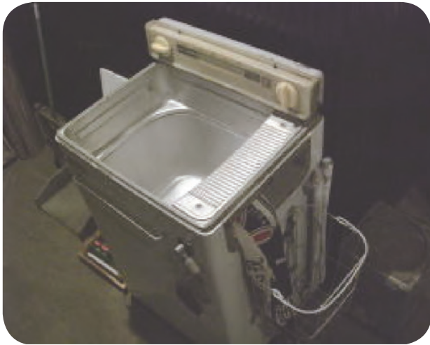
ローラーつきせんたく き 機