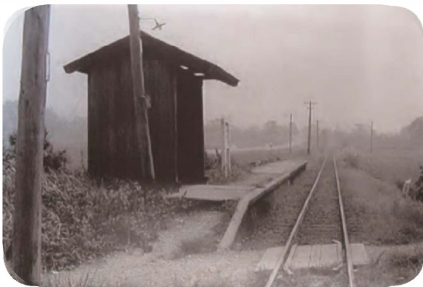
40年ほど前（昭和40年代）の五十岡駅