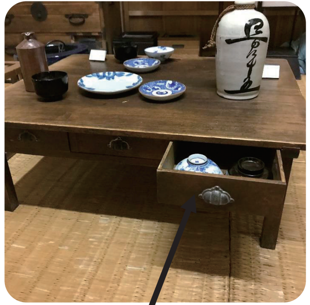
家族それぞれの食器を 入れるための引き出し