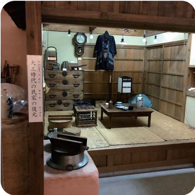
たいしよ 大正時代の民家の復元