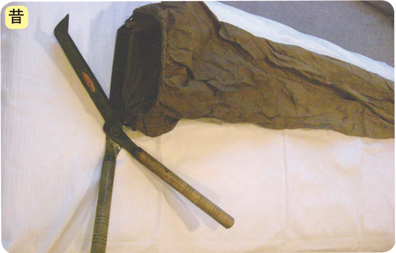
昔使っていた茶かりばさみ