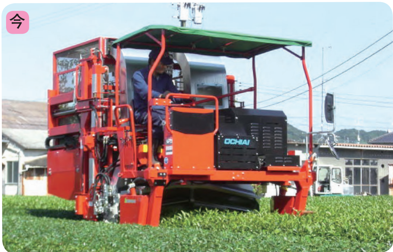
人が乗って運転する茶かりき