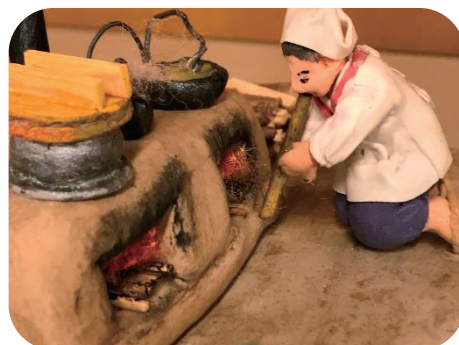
かまどで火を起こす様子