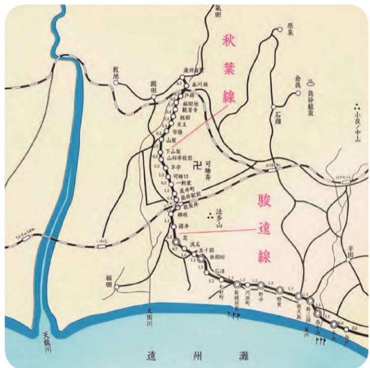
すんえん 駿遠線・秋葉線路線図