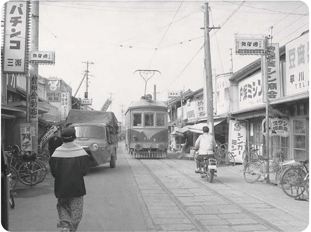
銀座通り（今の西通り）を走る路面電車