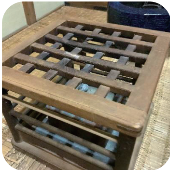
すみび 炭火こたつ