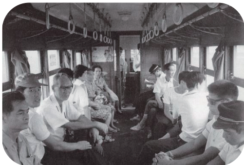
こんざつする車両の中