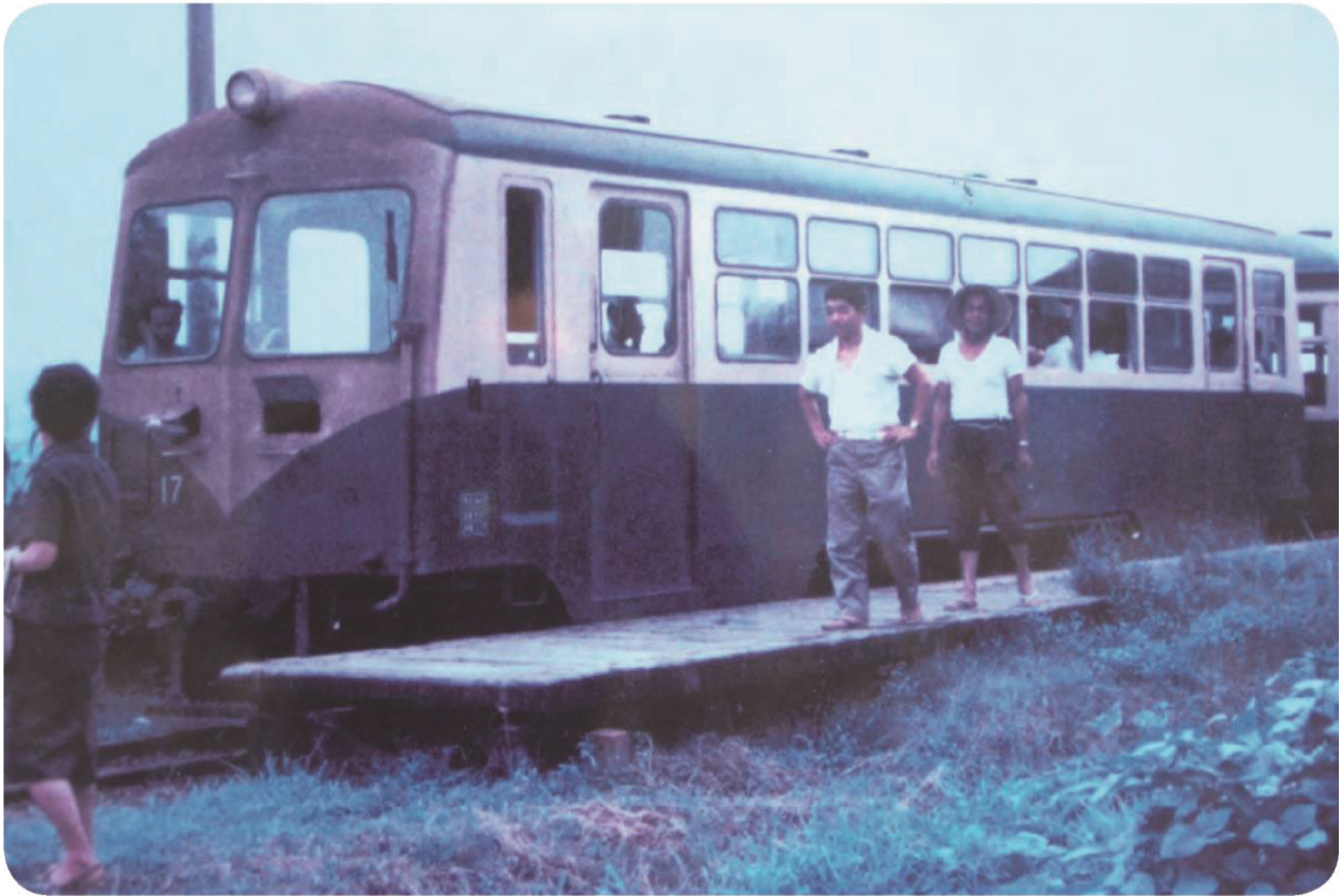
浅名 あさな ていりゆう場（浅羽地区）にとまる軽便鉄道